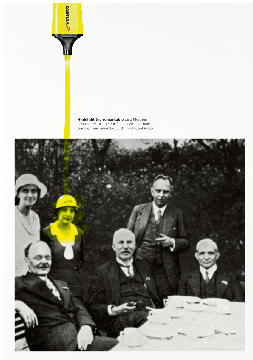
Highlight the remarkable Lise Meitner. Discoverer of nuclear fission whose male partner was awarded with the Nobel Prize.

[Subraya lo importante. Lise Meitner. Descubridora de la fisión nuclear cuyo compañero fue galardonado con el Premio Nobel.]