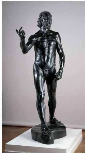
2A. A. Rodin: San Juan Bautista . 1933.