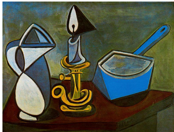
2B.P. Picasso: Jarra, vela y cacerola esmaltada . 1945.