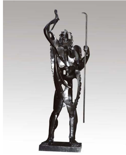
2B. P. Gargallo: El gran profeta . 1933.