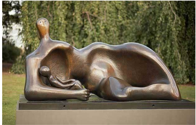
2B. Henry Moore. Madre e hijo reclinados . Bronce