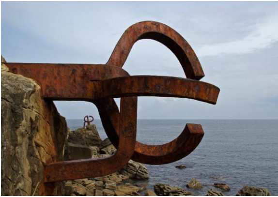
2A. E. Chillida: El peine de los vientos . 1976.