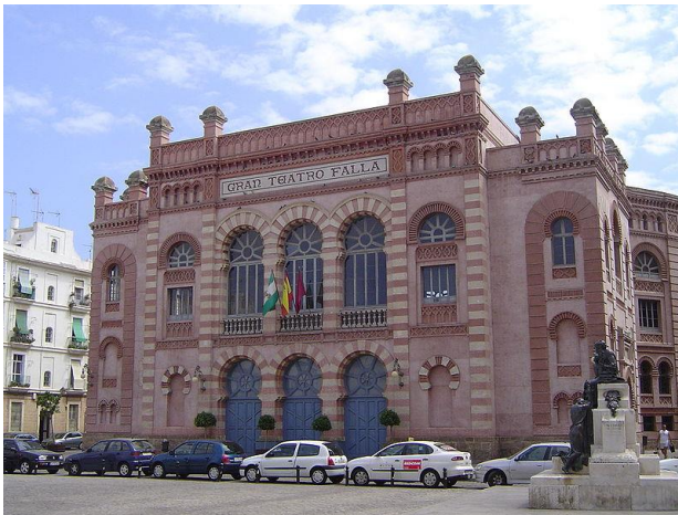
2A. Gran teatro Falla. 1884-1910. Cádiz.