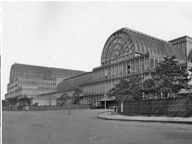
2B. J. Paxton: The Crystal Palace . 1851.