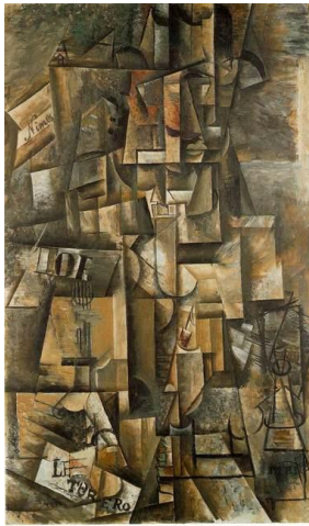
2A. Picasso. El aficionado . 1912.