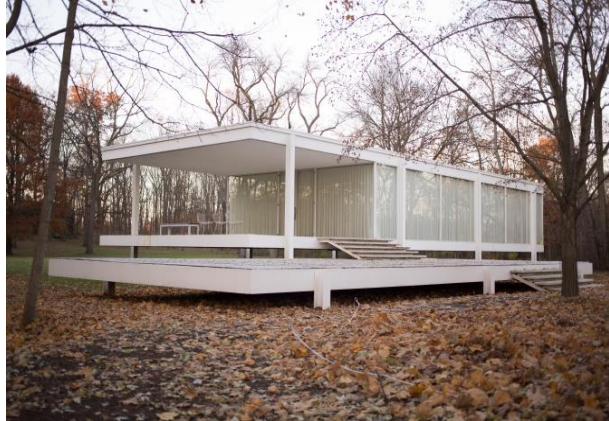
2B. M. van der Rohe: Casa Farnsworth . 1946