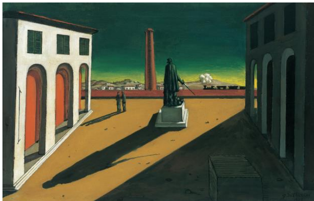
2A. G. de Chirico: Piazza . 1913.