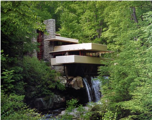
2A. F. Lloyd Wright: Casa de la cascada . 1936.