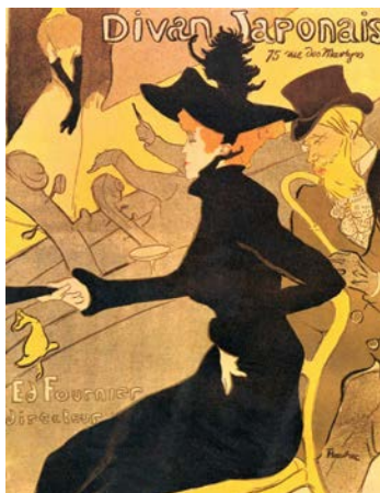
2A. Toulouse-Lautrec: Diván japonés (1893).