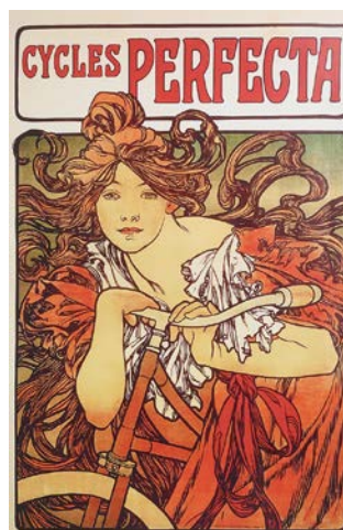
2B. Alfons Mucha: Cycles Perfecta (1902).