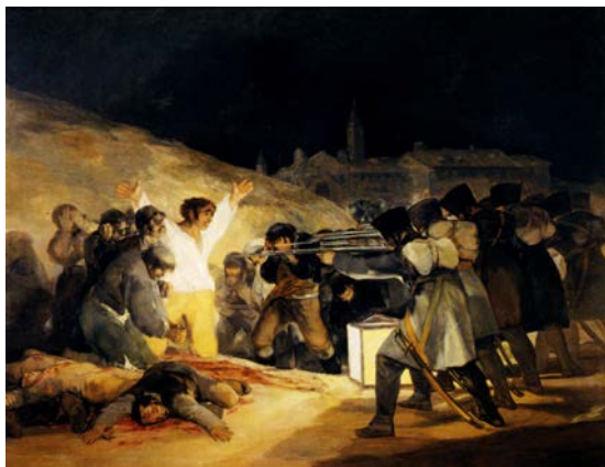
2A. Francisco de Goya: Fusilamientos del 3 de mayo (1814).