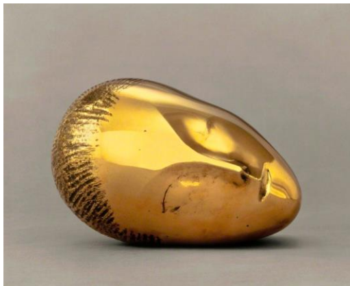
4A. C. Brancusi: Musa dormida . 1913.