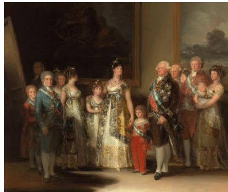
3B. F. Goya: La familia de Carlos IV . 1800.