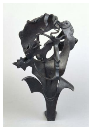
4B. P. Gargallo: Homenaje a Chagall . 1933.