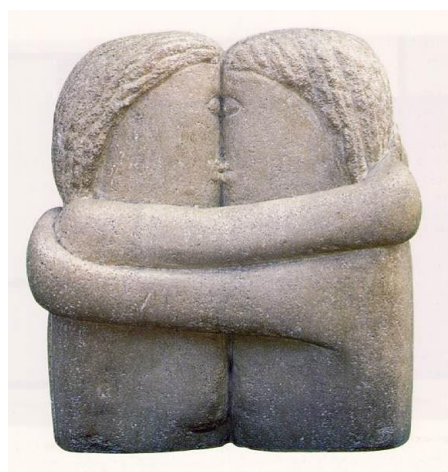
4B. C. Brancusi: El Beso . 1908.