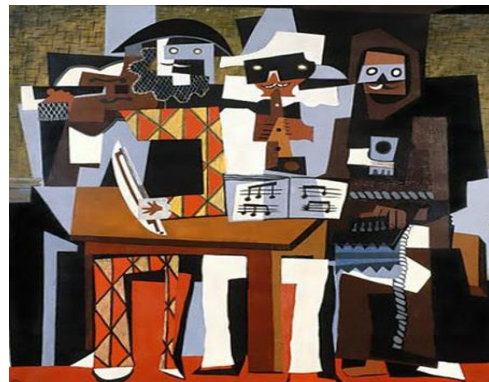
3B. P. Picasso: Tres músicos . 1921.