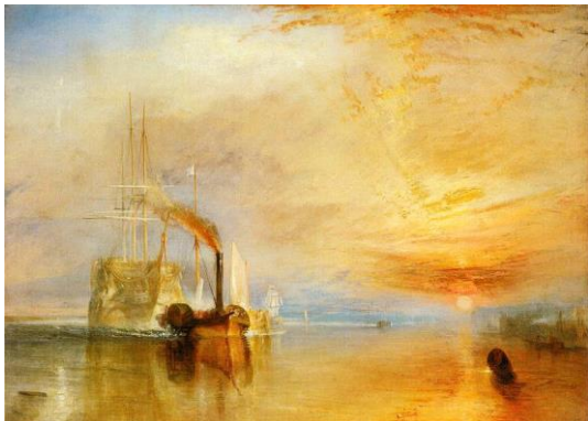
3A. W. Turner: El Temerario remolcado para desguace . 1839.