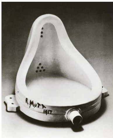
4A. M. Duchamp: La fuente . 1917.