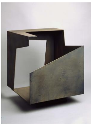
4A. J. Oteiza: Caja vacía . 1958.