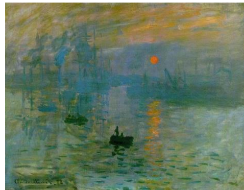
3B. C. Monet: Impresión, Sol Naciente . 1872.