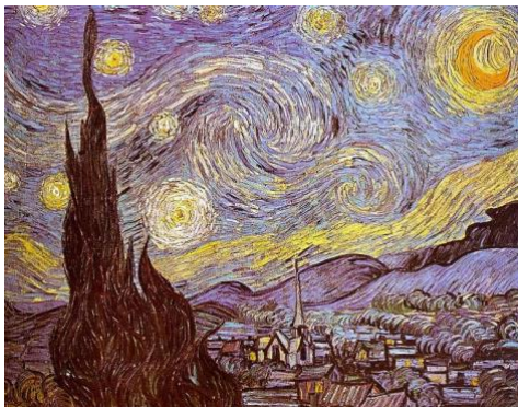
3A. V. Gogh: La Noche Estrellada . 1889.