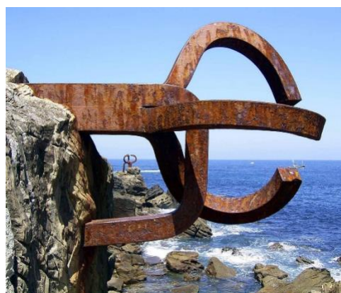
4B. E. Chillida: El peine de los vientos . 1977.