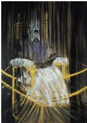
3A. F. Bacon: Estudio del retrato de Inocencio X de Velázquez . 1953.