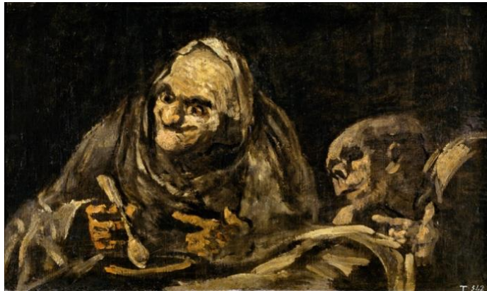
3B. F. Goya: Dos viejos comiendo sopa . 1820-1823.