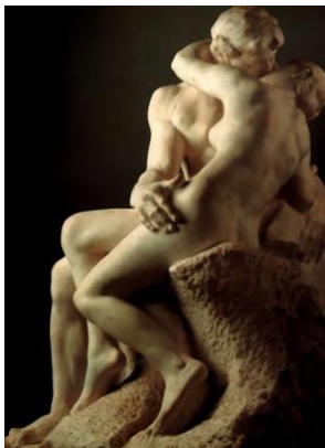
4A. A. Rodin: El beso . 1889.