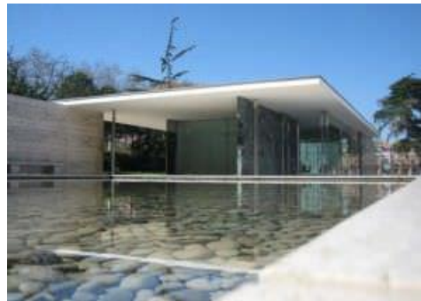
4B. L. Mies van der Rohe: Peabellón de Alemania . 1929.