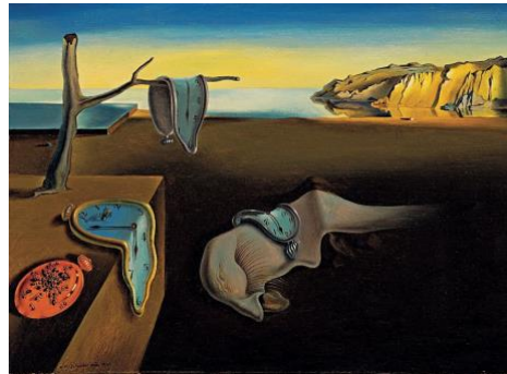
3B. S. Dalí: La persistencia de la memoria . 1931.