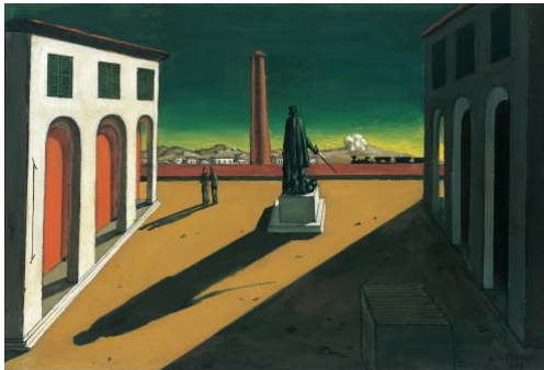
3A. G. de Chirico: La plaza . 1913.