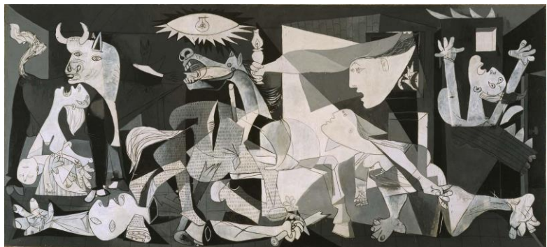
4B. P. Picasso, Guernica , 1937.