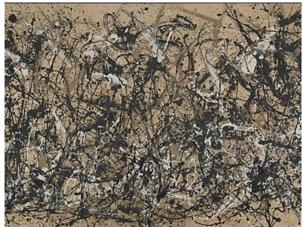
3B. J. Pollock, Ritmo de otoño (número 30) , 1950. (detalle)