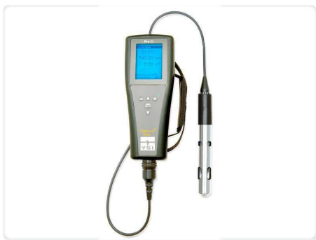
Figura 1. Fotografia d'un oxímetre