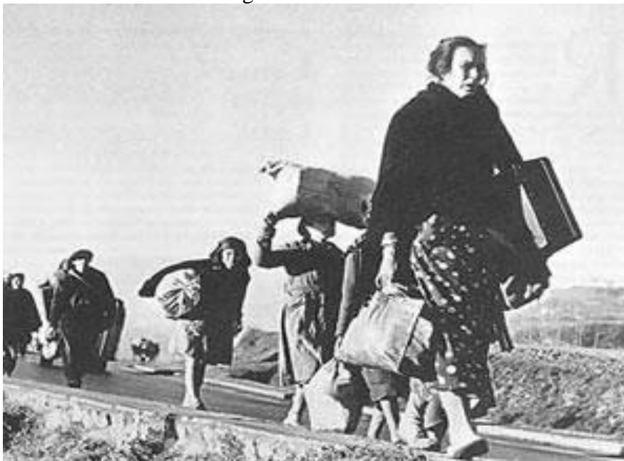
Fotografía de Robert Capa de un grupo de españoles camino del exilio a Francia.

FUENTE HISTÓRICA: Relacione esta fotografía con el exilio durante la dictadura franquista.