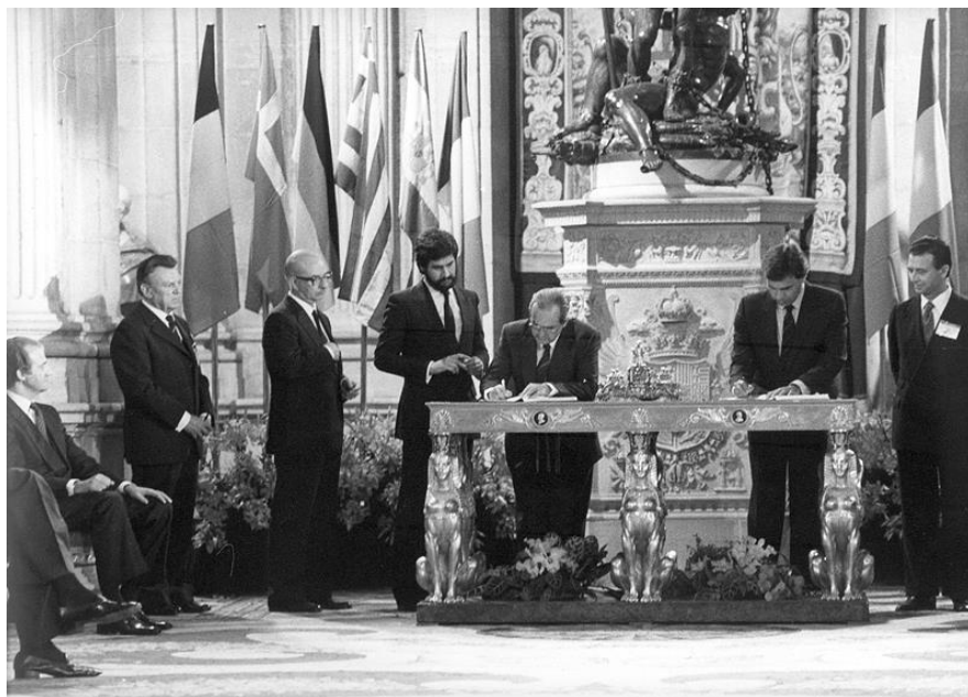
Firma del Tratado de Adhesión de España a la CEE. 12 de junio de 1985. Página web del Ministerio de Asuntos Exteriores y de Cooperación

FUENTE HISTÓRICA: Relacione esta imagen con la integración de España en Europa