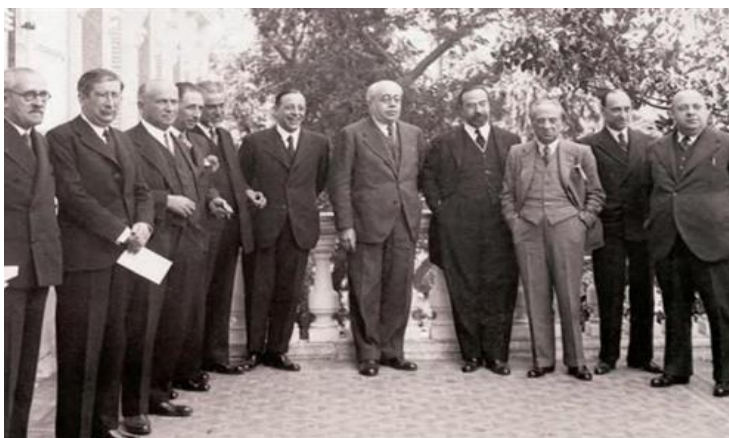
Cuarto gobierno republicano de Manuel Azaña, 1933.

Relacione esta imagen con el bienio reformista (1931-1933) en la Segunda República.