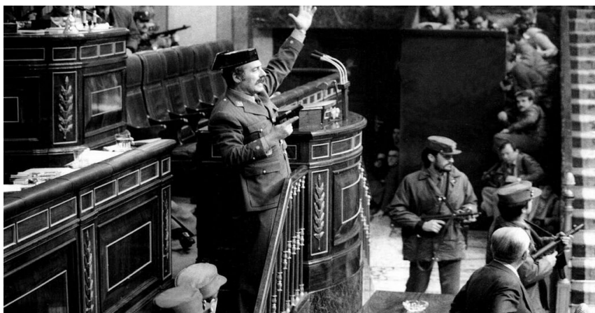
Teniente Coronel Antonio Tejero en el Congreso de los Diputados.