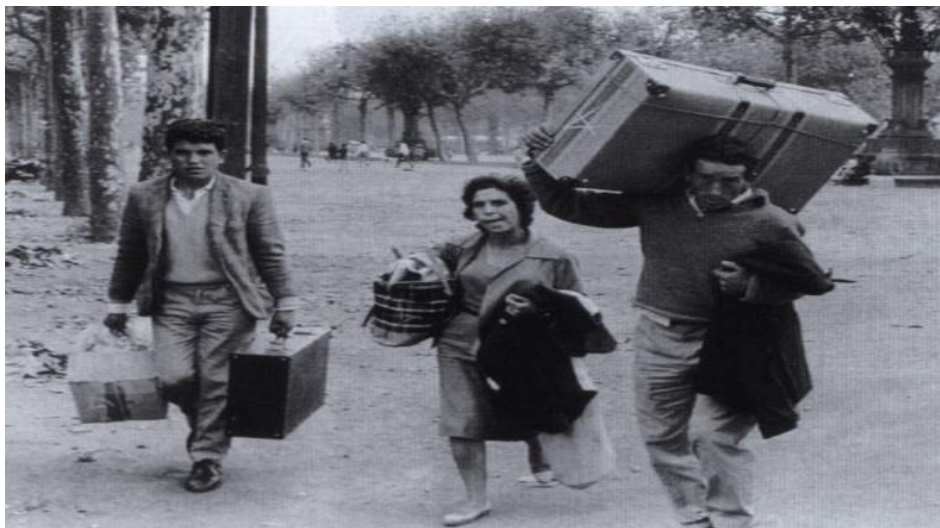
Emigrantes saliendo de la Estación de Francia, Barcelona, 1962