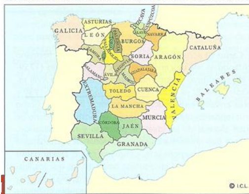
ESTRUCTURA ADMINISTRATIVA DE LA ESPAÑA DEL SIGLO XVIII