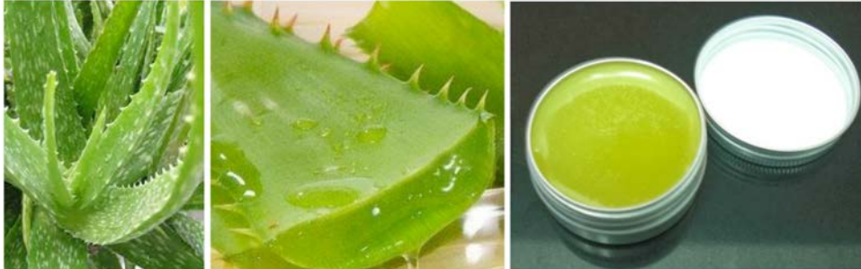
IMATGE C. Detall d'un Aloe vera , secció d'una fulla i bàlsam labial elaborat amb aquesta planta

Una empresa dedicada als productes d'higiene corporal comercialitza una nova línia de productes d'àloe ( Aloe vera ): cremes, sèrums, bàlsams labials, sabó sòlid, sabó líquid, xampú, etc.