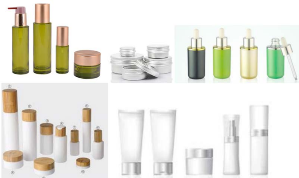
IMATGE D. Diferents tipus d'envasos per a productes d'higiene corporal

També cal que plantegeu, en termes molt generals, on col·locaríeu aquest logotip en una col·lecció d'envasos de mides i formes diferents. En la imatge D podem observar alguns envasos comercials que us poden servir com a font d'inspiració. Proposeu un mínim de quatre aplicacions del vostre logotip d'Oè en envasos de productes ben diferenciats (per exemple: un pot de bàlsam labial, una pastilla de sabó de mans, un pot petit de crema facial, una ampolla de xampú o un pot de crema corporal), de manera que tots els productes tinguin una cohesió gràfica i s'identifiqui ràpidament que es tracta de la mateixa marca.