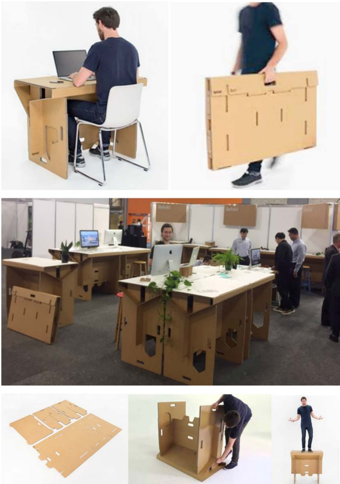
IMATGE B. Fotografies de l'escriptori Refold, dissenyat per Fraser Callaway, Oliver Ward i Matt Innes (Nova Zelanda)

En la imatge B podem observar fotografies de l'escriptori de cartró ondulat Refold. L'escriptori és 100 % reciclable i fàcil de transportar, ja que es pot plegar, i es munta en dos minuts. Segons els dissenyadors, aquestes característiques poden contribuir a canviar la manera com treballem.