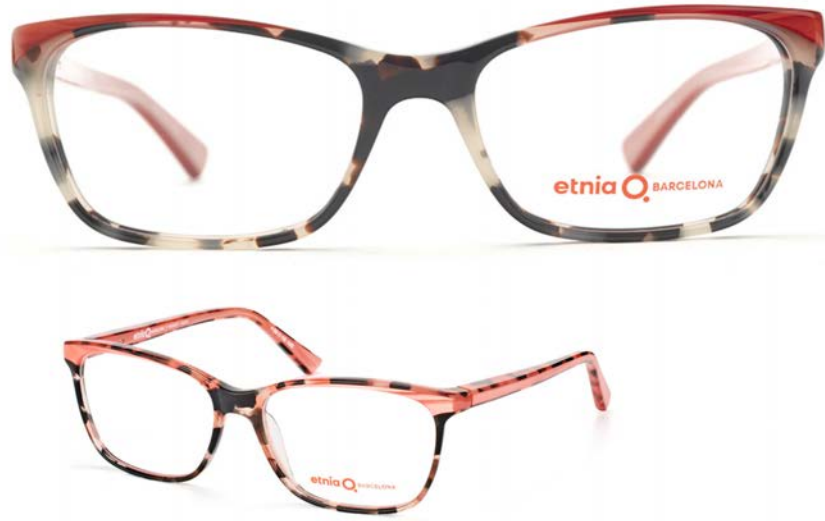
IMATGE H. Exemple d'ulleres d'Etnia Barcelona

Desenvolpeu, a la pàgina 15 d'aquest quadern (i també a les pàgines 10 i 11, si necessiteu més espai):