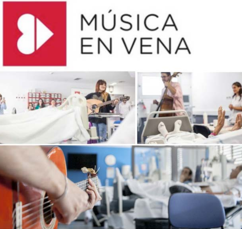
IMATGE D. Imatge gràfica de Música en Vena i fotografies dels seus microconcerts

Música en Vena (imatge D) és una associació sense ànim de lucre que es dedica a fer més agradables les estades hospitalàries de pacients, familiars i personal sanitari a través de la música en directe. El seu objectiu és contribuir a millorar la societat impulsant la música com a eina d'acció social. Els artistes es poden apuntar de manera altruista al web de l'associació per a organitzar les actuacions. Gràcies a aquesta associació, ja s'han beneficiat de la iniciativa 44.000 pacients, i els músics han celebrat més de 2.200 microconcerts en directe.