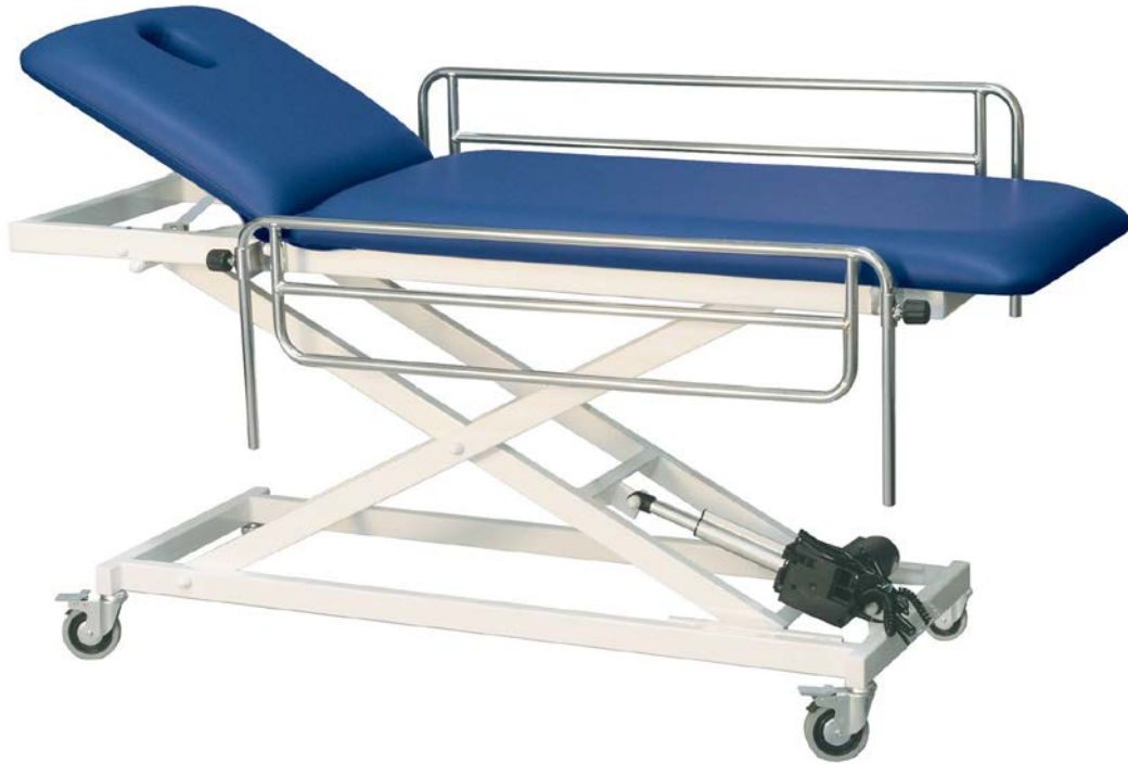
IMATGE B. Llitera hidràulica per a hospitals

En la imatge B es mostra una llitera d'hospital, que s'utilitza per a transportar els pacients d'un lloc a un altre o per a atendre'ls en una consulta mèdica. És important que la llitera funcioni correctament, ja que això permetrà que els pacients siguin atesos adequadament i que el personal sanitari pugui dur a terme la seva feina d'una manera òptima.