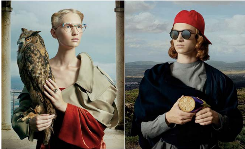
IMATGE F. Algunes mostres del material promocional d'Etnia Barcelona

Etnia Barcelona (imatge F) fa quinze anys que fabrica de manera artesanal ulleres de qualitat. Aquesta marca crea les col·leccions inspirant-se en mites del món de l'art i la fotografia, i té devoció per la cultura, els viatges i la moda. Cada col·lecció parteix d'un procés creatiu obert, que posa molta cura en els materials i especialment en el color.