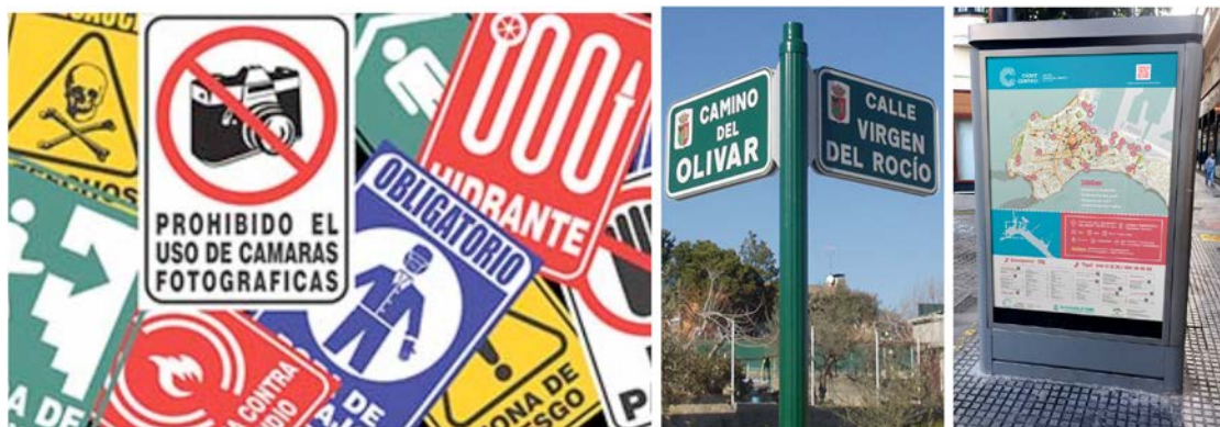
IMATGE A. Diversos suports gràfics amb funcions semblants

Avui dia vivim en un món global. Hi ha un gran flux de persones que, lliurement o per força, es mouen arreu del món. Gent provinent de diferents cultures i amb una gran diversitat lingüística es mou per feina, turisme, estudis, per millorar les seves condicions de vida... Això fa que les persones es trobin en situacions noves o en espais desconeguts, i que estiguin perdudes i desinformades.