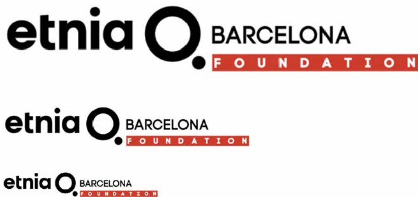
IMATGE G. Imatge gràfica de la Fundació Etnia Barcelona

Però la marca té també una fundació (imatge G) amb la qual porta a terme un projecte solidari que proporciona atenció òptica i aporta assistència a les famílies més vulnerables.