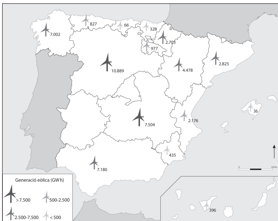
L'energia eòlica a Espanya