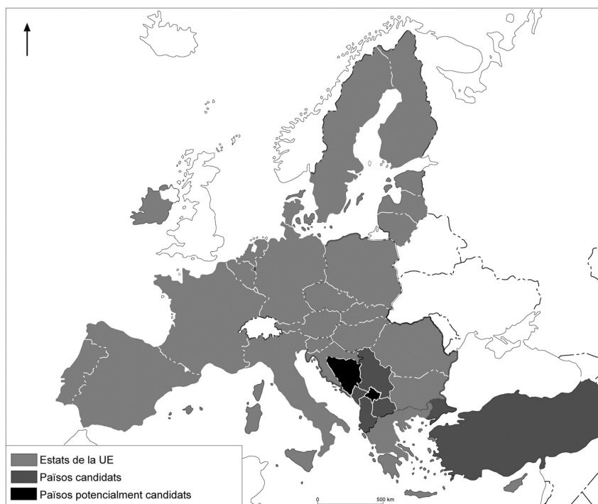
Composició de la Unió Europea