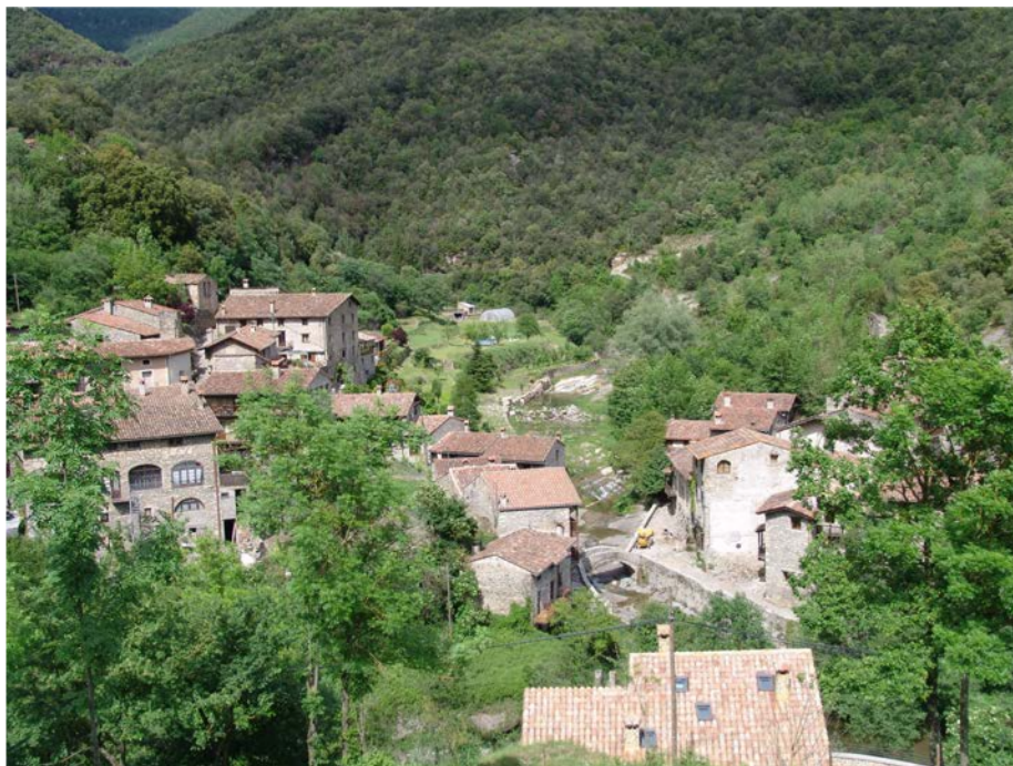
Paisatge de muntanya mitjana