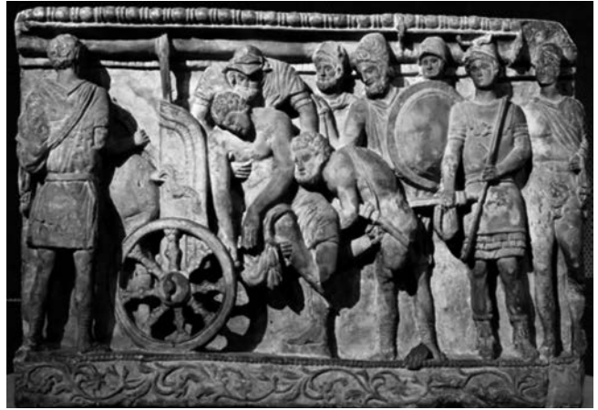
Museu Arqueològic Nacional de Florència