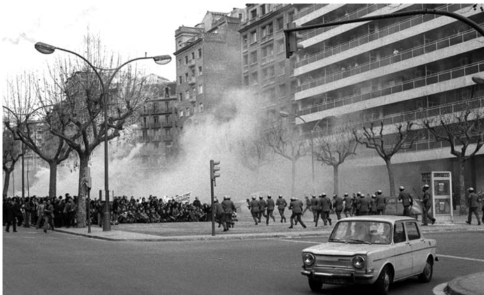
Manifestació proamnistia a Barcelona. FONT: Manel Armengol, 1976.