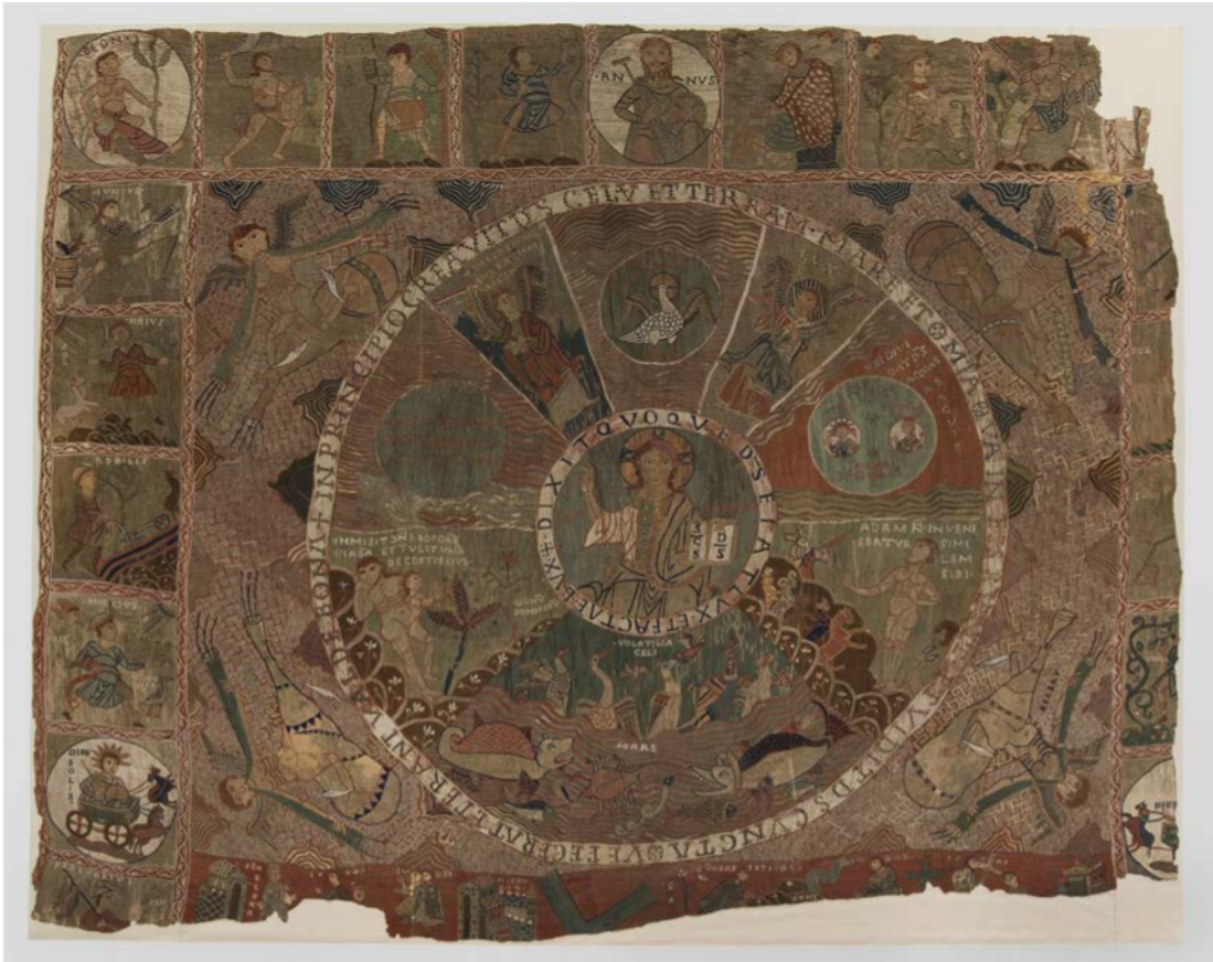
Tapis o Brodat de la Creació (catedral de Girona)

a) Dateu l'obra i situeu-la en el context històric i cultural corresponent.