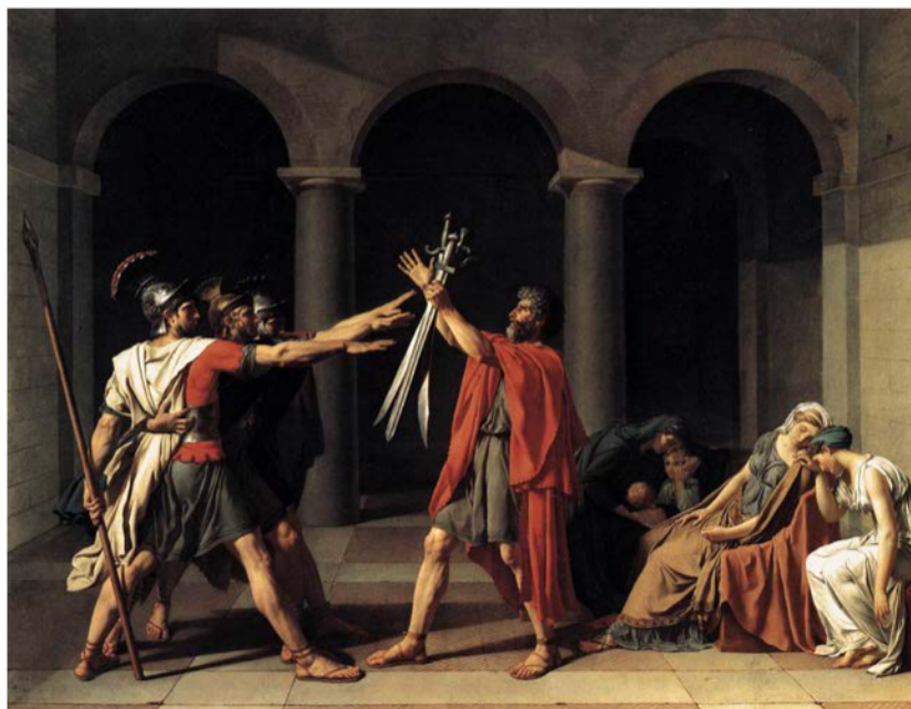
El jurament dels Horacis , de Jacques-Louis David