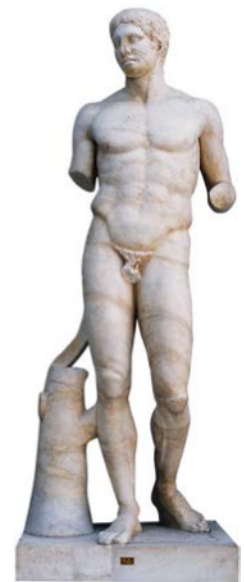
Doriforos , de Policlet

e) Expliqueu els conceptes contrapposto i cànon a partir de l'escultura reproduïda a continuació.