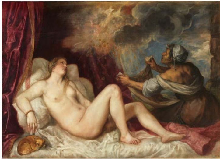
Dànae rebent la pluja d'or , de Ticià, 1560-1565 (Madrid, Museu del Prado)