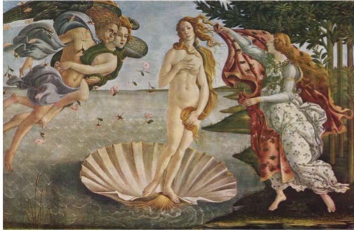
El naixement de Venus , de Sandro Botticelli, 1482-1486 (Florència, Galeria dels Uffizi)