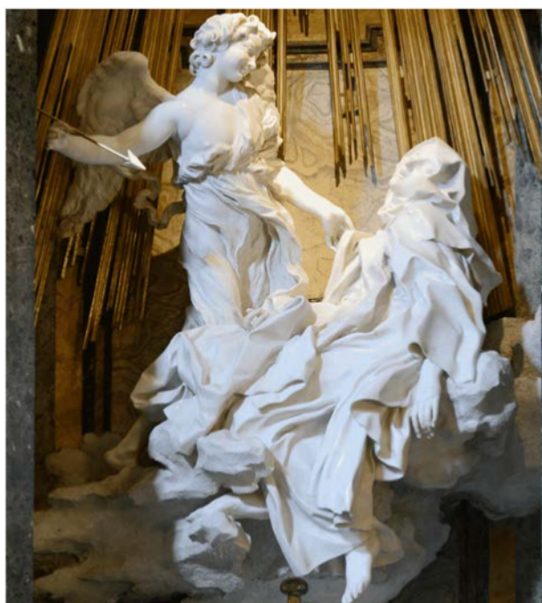
Èxtasi de santa Teresa de Jesús , de Gian Lorenzo Bernini

a) Dateu l'obra i situeu-la en el context històric i cultural corresponent.