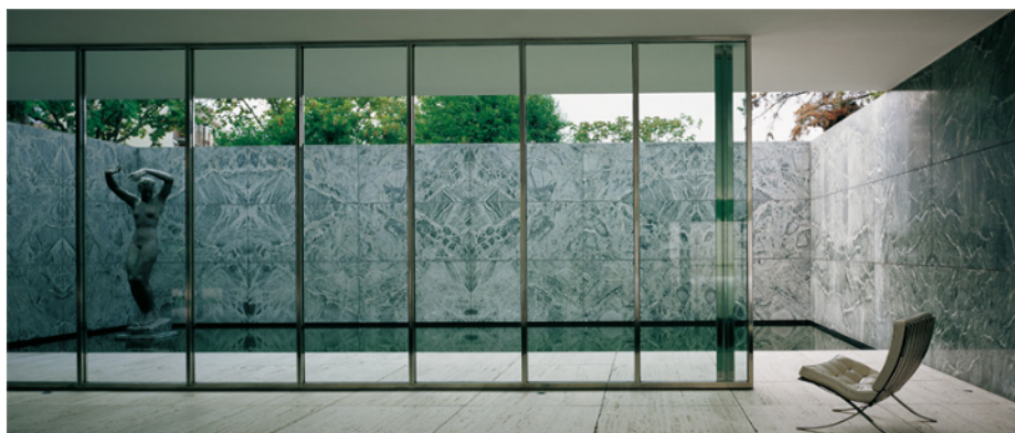
Pavelló Alemany de Barcelona, de Mies van der Rohe