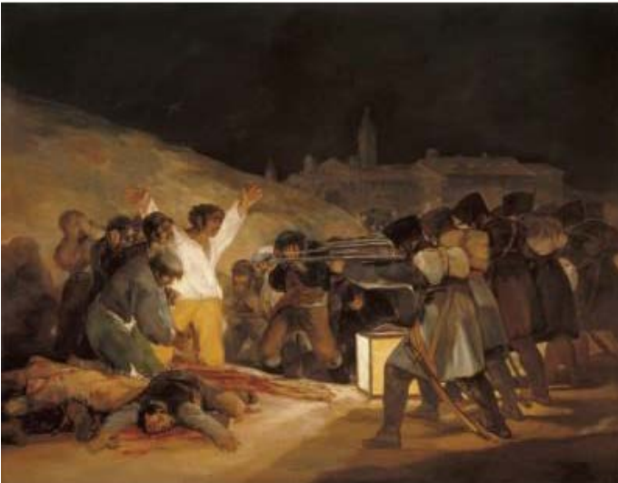
Lámina nº 1. Los fusilamientos (1814), de Francisco de Goya, Museo del Prado, Madrid.