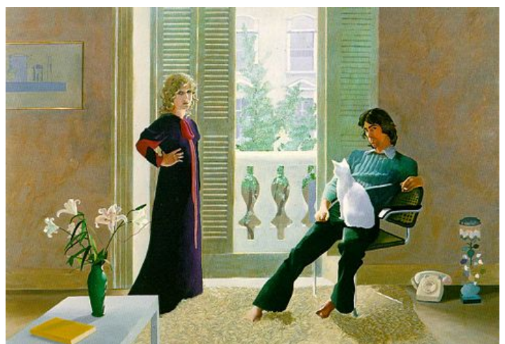
Nº4. Mr and Mrs Clark and Percy (1970-1971), de David Hockney, Tate Gallery, Londres.