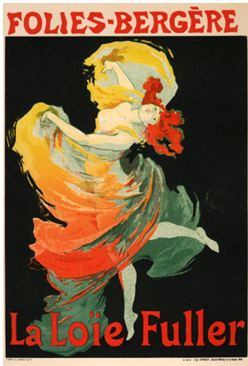
Nº 3. Folies-Bergère: La Loïe Fuller (1893), de Jules Chéret.