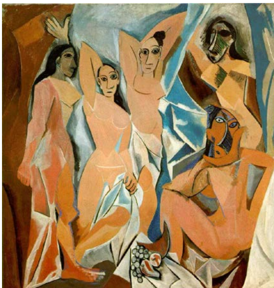
Lámina nº1. Las señoritas de Avignon (1907), de Pablo Picasso, Museo de Arte Moderno de Nueva York.