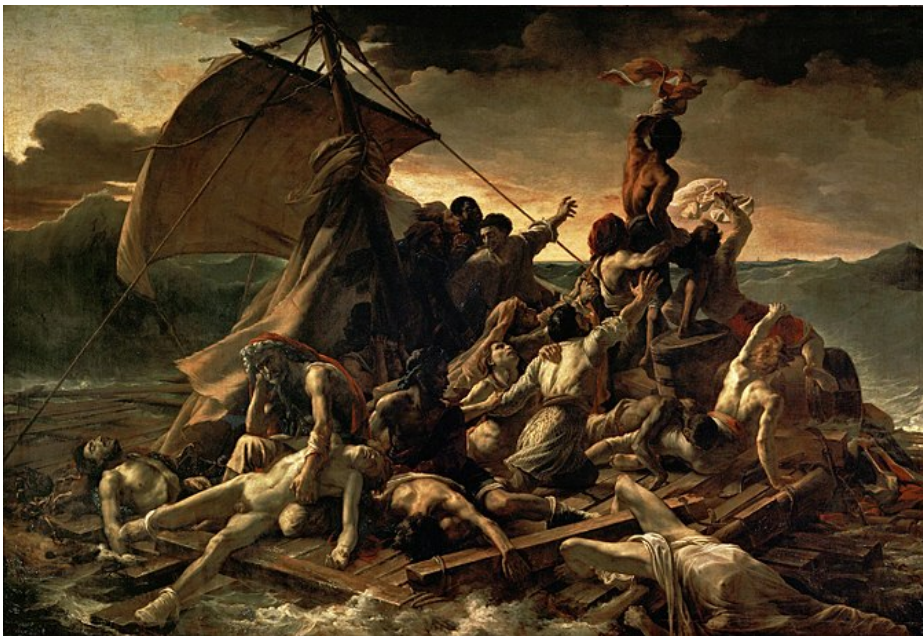
Lámina nº 1. La balsa de la Medusa (1819), de Théodore Géricault, Museo del Louvre.