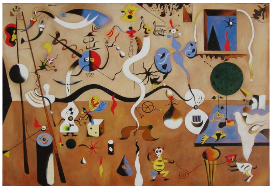
Lámina nº 2. El Carnaval de Arlequín (1924-1925), de Joan Miró, Albright-Knox Art Gallery en Buffalo (EE.UU).