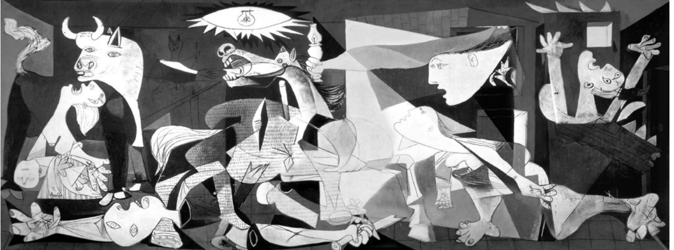
Lámina nº 3. Guernica (1937), de Pablo Picasso, Museo Nacional Centro de Arte Reina Sofía, Madrid.