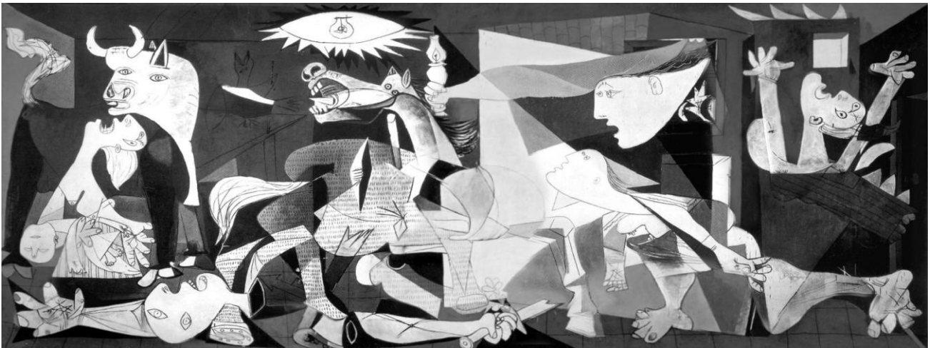
Lámina nº 2. Guernica (1937), de Pablo Picasso, Museo Nacional Centro de Arte Reina Sofía, Madrid.