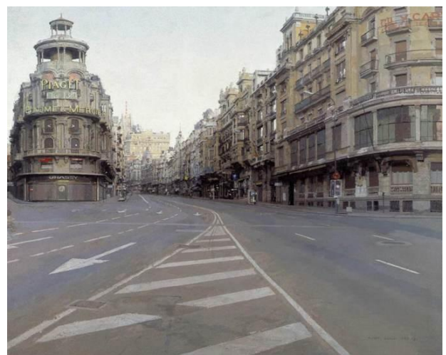
Lámina nº 4. Gran Vía de Madrid (1974-1981), de Antonio López, colección privada.