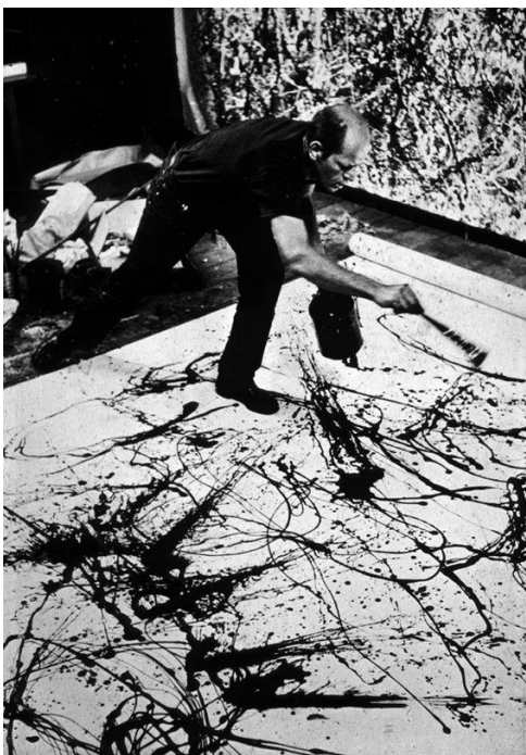
Lámina nº 3. El pintor Jackson Pollock realizando una de sus obras.