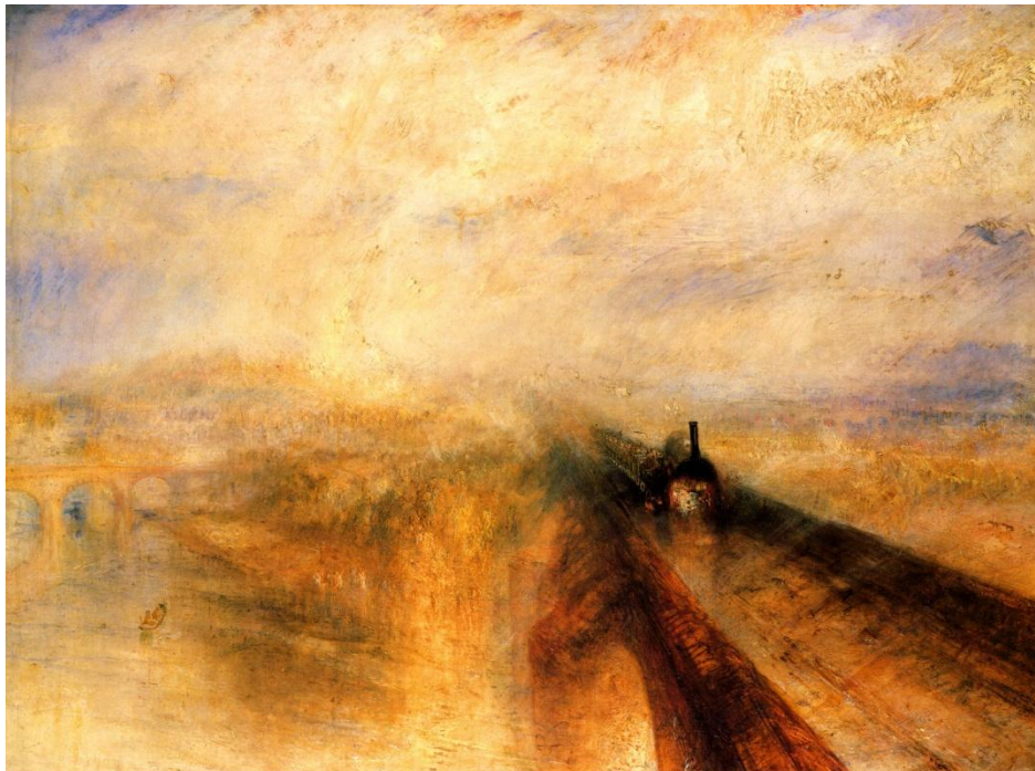
Lámina nº 1. Lluvia, vapor y velocidad (1844), J.M.W. Turner, National Gallery, Londres.