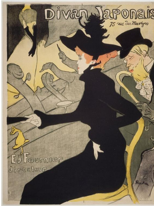
Lámina nº 2. Divan Japonais (hacia 1892-1893), Henri de Toulouse-Lautrec.