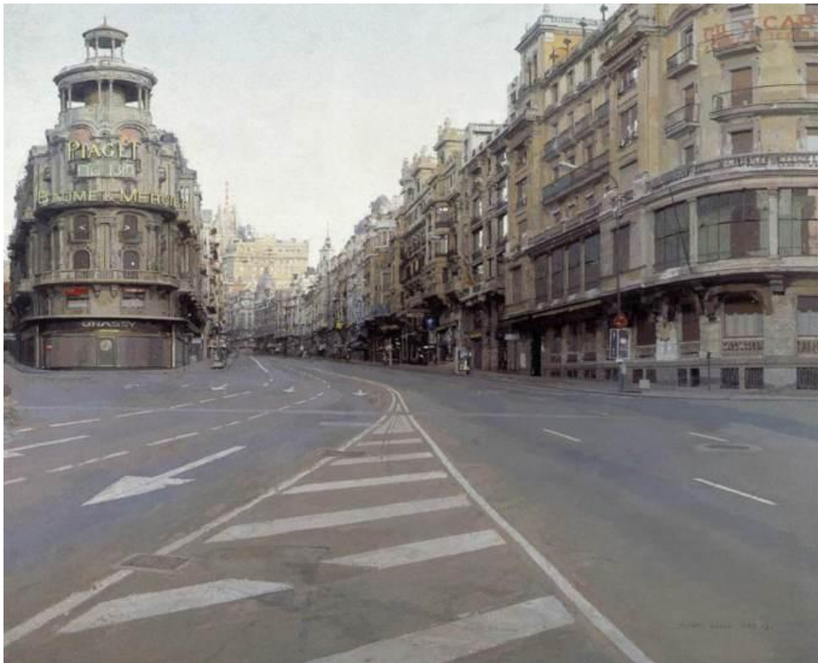
Lámina nº 4. Gran Vía de Madrid (1974-1981), Antonio López, colección privada.