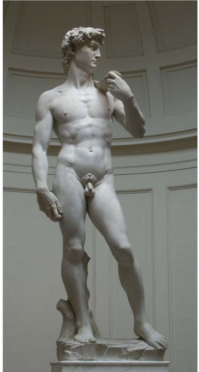
Lámina 4. David (1501-1504), Miguel Ángel Bounarroti (Galería de la Academia, Florencia).