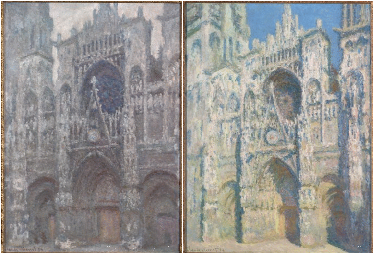
Lámina 2. En la izquierda, La cathédrale de Rouen. Le portail, temps gris (1892), Claude Monet (Musée d'Orsay, París) y, en la derecha, La cathédrale de Rouen. Le portail et la tour Saint-Romain, plein soleil (1893), Claude Monet (Musée d'Orsay, París).