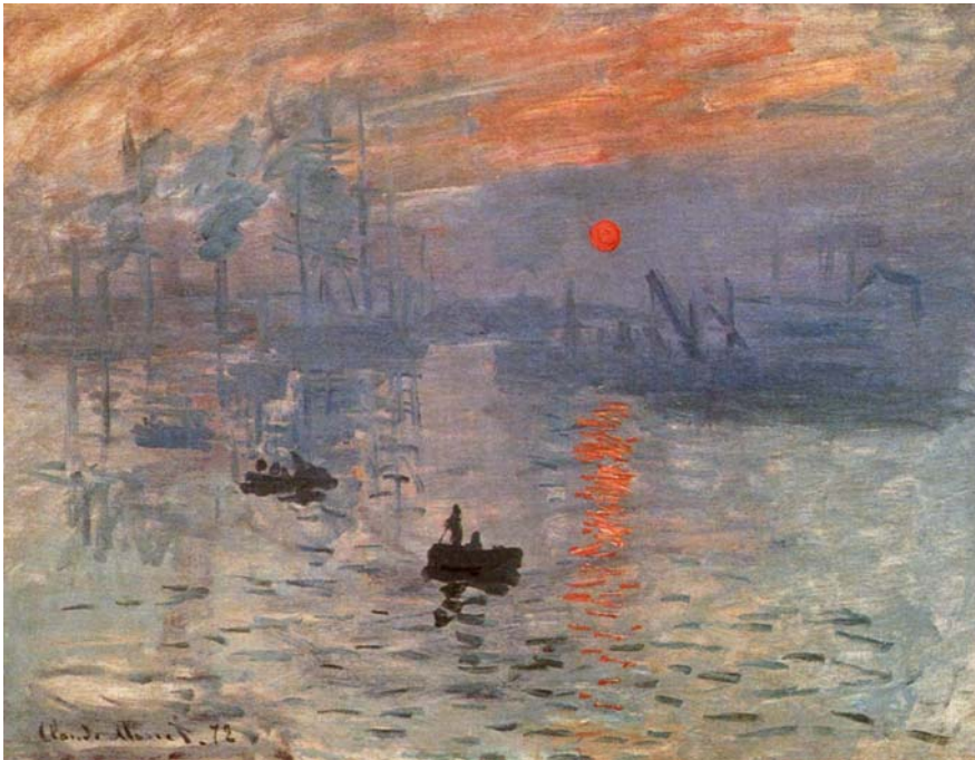
Impresión, sol naciente (1872), Claude Monet, Museo Marmottan-Monet, París.