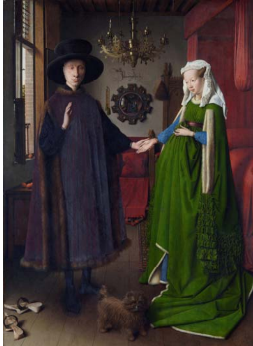
El matrimonio Arnolfini (1434), Jan van Eyck, National Gallery, Londres.