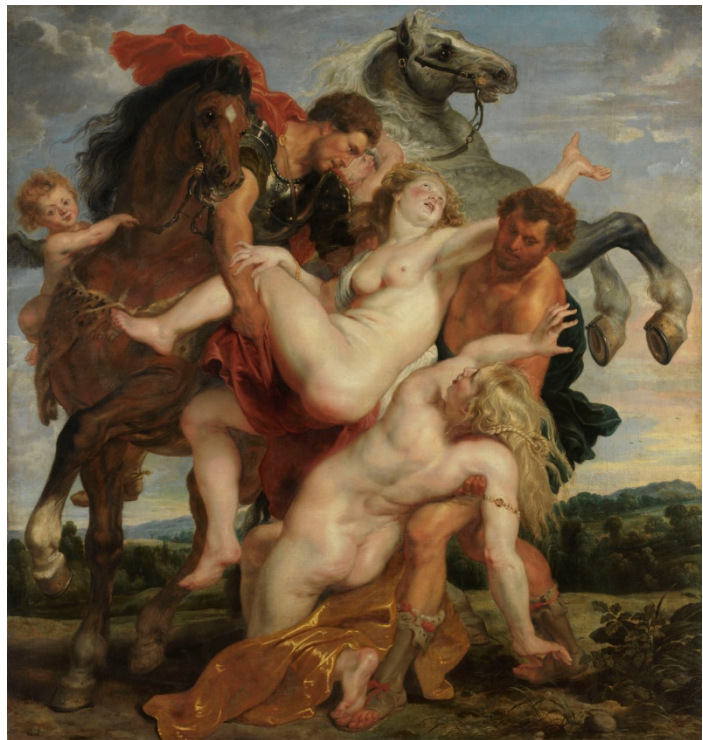
Lámina nº 2. El rapto de las hijas de Leucipo (1616), Pedro Pablo Rubens, Late Pinakothek, Múnich.