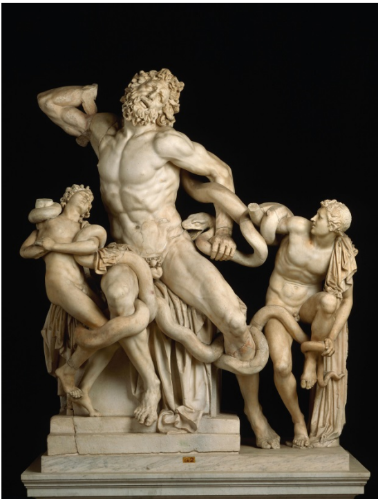
Lámina nº 1. Laocoonte y sus hijos (copia de mármol de mediados del siglo I d. C.), Agesandro, Polidoro y Atenodoro, Museo Pío-Clementino, Vaticano.