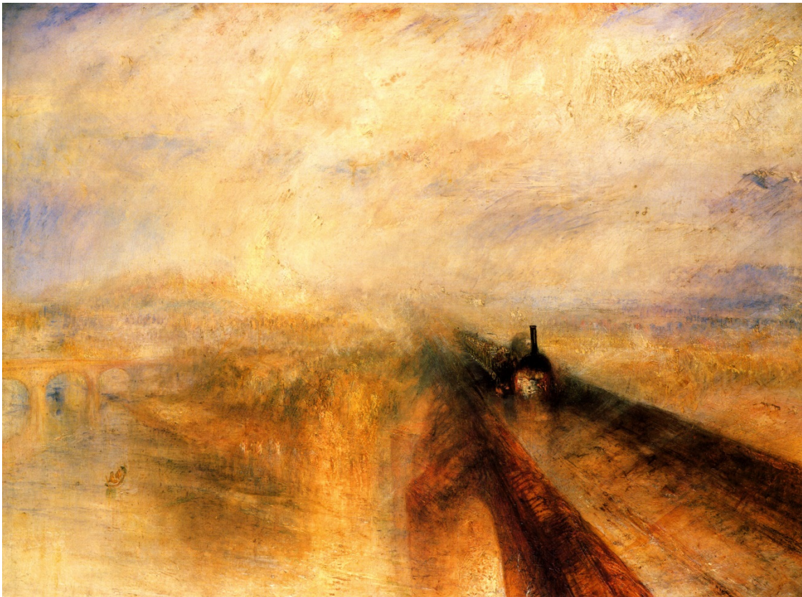
Lámina nº 4. Lluvia, vapor y velocidad (1844), J.M.W. Turner, National Gallery, Londres.