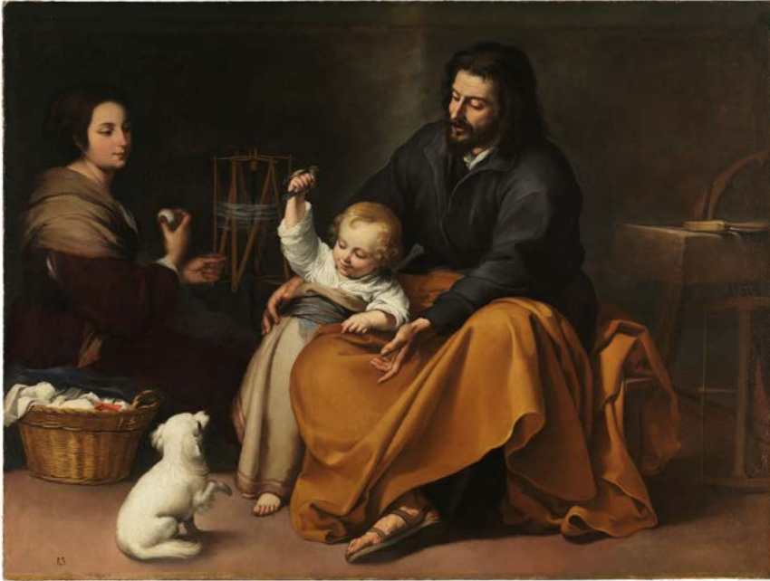
Nº 3. La Sagrada Familia del pajarillo (hacia 1650), Bartolomé Esteban Murillo, Museo del Prado, Madrid.