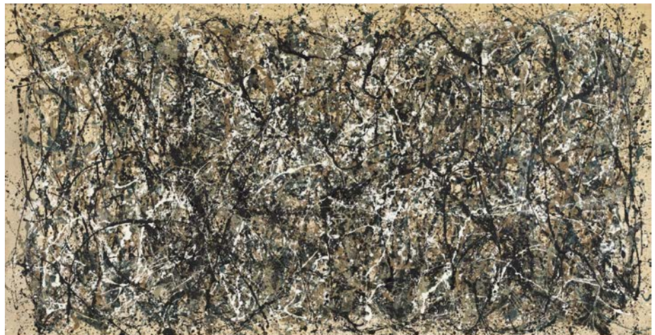
Nº 2. One: number 31 , (1950), de Jackson Pollock, MoMA, Nueva York.