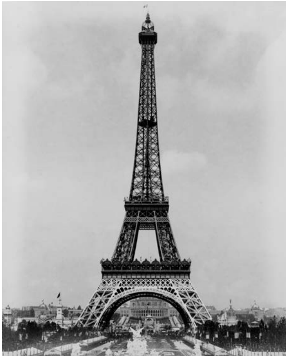
Nº 1. Tour Eiffel (1887-1889), Gustave Eiffel (París).