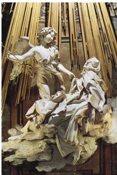
Lámina nº 2. El éxtasis de Santa Teresa (1647-1651), Gian Lorenzo Bernini, Santa María de la Victoria, Roma.