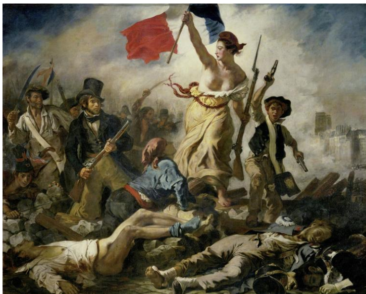
Lámina nº 3. La Libertad guiando al pueblo (1830), de Eugène Delacroix, Museo del Louvre, París.