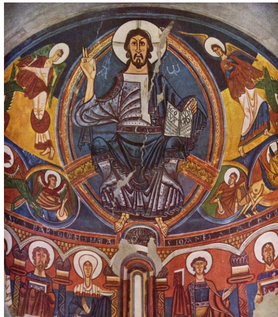
Lámina nº 1. Pantocrátor del ábside de San Clemente de Tahull (c. 1123), Maestro de Tahull, Museo Nacional de Arte de Cataluña, Barcelona.