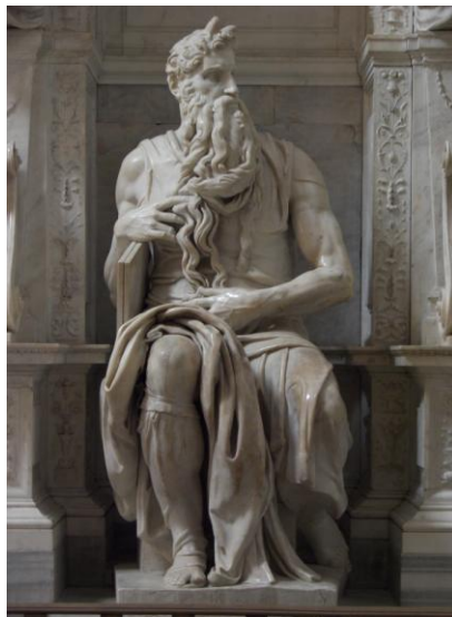
Lámina nº 3. Moisés (1509), Miguel Ángel Buonarroti, San Pietro in Vincoli, Roma.