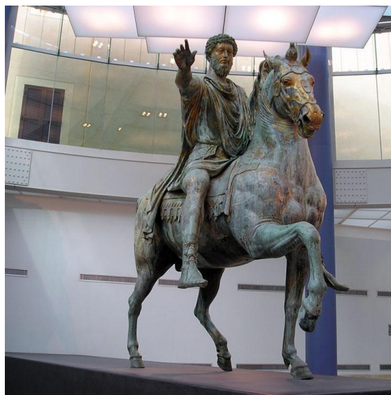
Lámina nº 1. Estatua ecuestre de Marco Aurelio (bronce, 176 d.C.), Museo Capitolino, Roma.