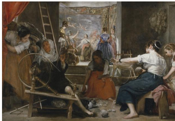
Lámina nº 4. Las hilanderas (c. 1657), Diego Velázquez, Museo del Prado, Madrid.