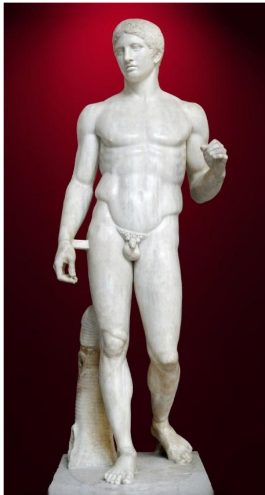
Lámina nº 1. Doríforo (copia en mármol. Hacia el 440 a.C.), Policleto, Museo Arqueológico Nacional de Nápoles.