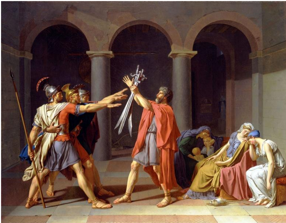
Lámina nº 2. El Juramento de los Horacios (1784), Jacques-Louis David, Museo del Louvre, París.