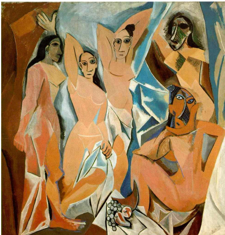
Lámina nº 4. Las señoritas de Avignon (1907), Pablo Picasso, Museo de Arte Moderno de Nueva York.