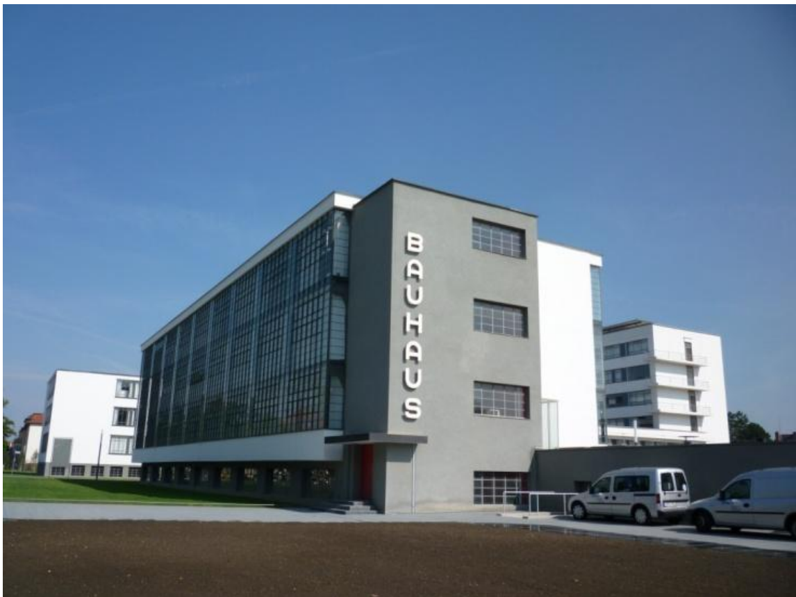
Lámina nº 4. La Bauhaus (1925-1926), Walter Gropius, Dessau (Alemania).