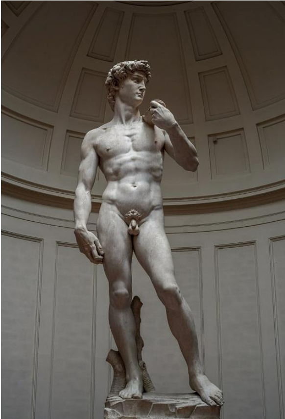
Lámina nº 2. David (1501-1504), Miguel Ángel Buonarroti, Galería de la Academia, Florencia.