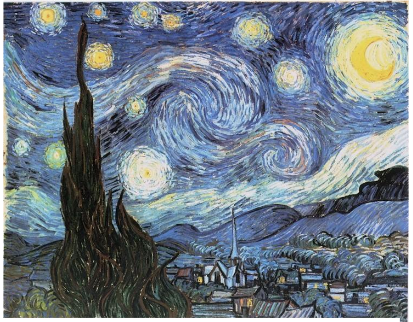
Lámina nº 3. La noche estrellada (1889), Vincent van Gogh, Museo de Arte Moderno de Nueva York.