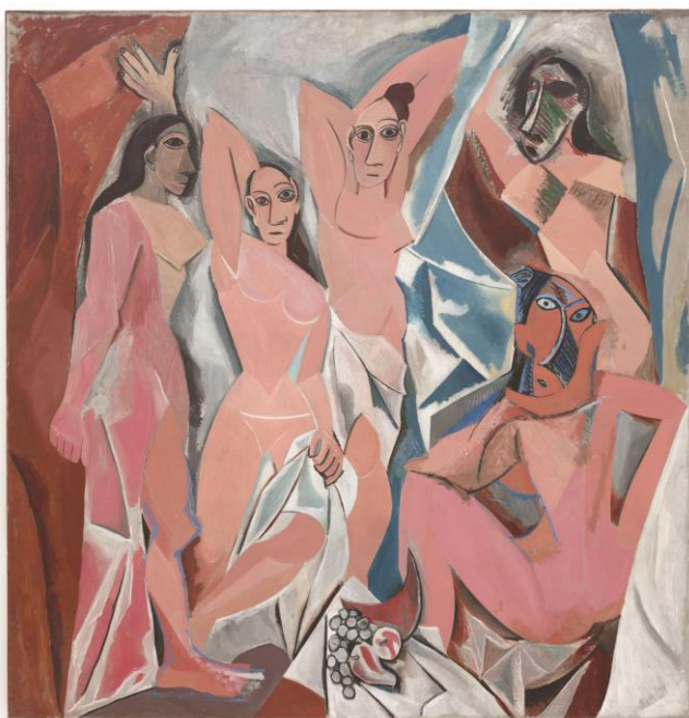
Lámina nº 4. Las señoritas de Avignon (1907), Pablo Picasso, Museo de Arte Moderno de Nueva York.