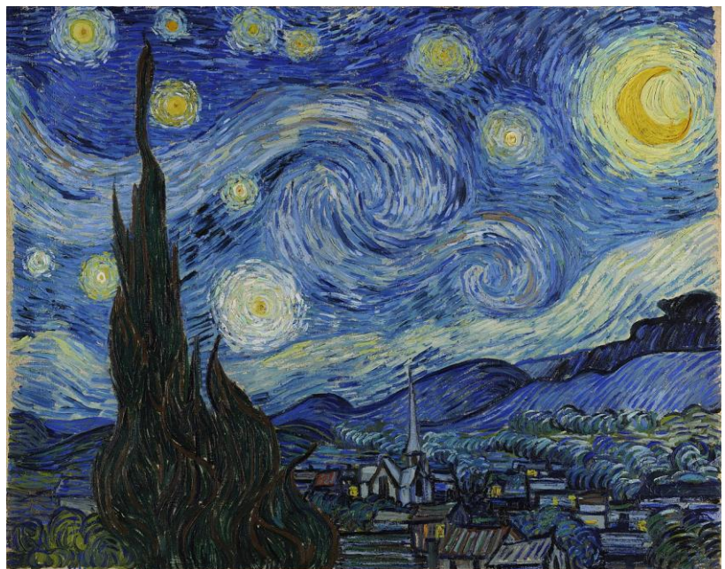
Lámina nº 3. La noche estrellada (1889), Vincent van Gogh.