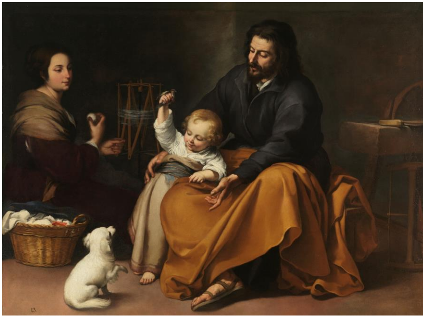
Lámina nº 2. La Sagrada Familia del pajarillo (hacia 1650), Bartolomé Esteban Murillo, Museo del Prado, Madrid.