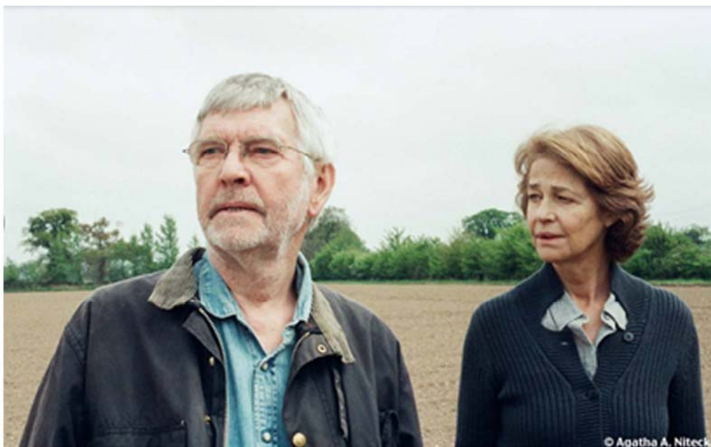
'45 Years' ('45 años'), de Andrew Haigh (Reino Unido).