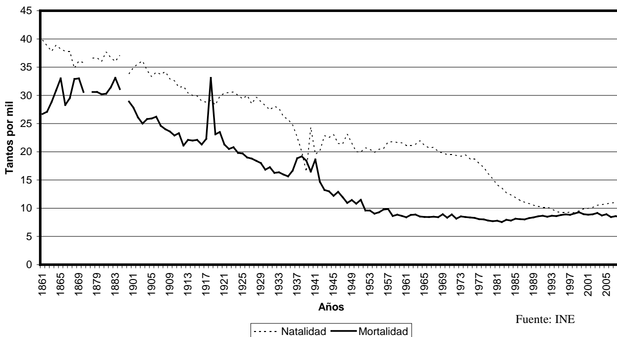
Evolución de la natalidad y la mortalidad en España (1861-2008)

III.- Conceptos. (Hasta 2 puntos) Defina con la mayor precisión posible UNICAMENTE CINCO de los siguientes términos.