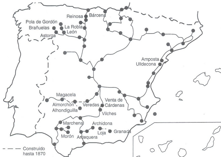
Mapa de los ferrocarriles españoles hasta 1870

* A partir de sus conocimientos y del material adjunto desarrolle el tema: Transformaciones económicas y cambios sociales en el siglo XIX (Desamortizaciones / Industrialización y modernización de las infraestructuras / Crecimiento demográfico y cambio social. El movimiento obrero). Valoración máxima: 6 puntos.