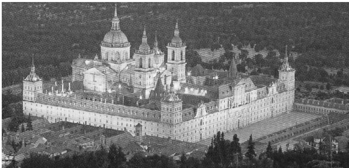
Monasterio de El Escorial

* A partir de sus conocimientos y del material adjunto desarrolle el tema: El siglo XVI (El imperio de Carlos V. Conflictos internos: Comunidades y Germanías / La Monarquía Hispánica de Felipe II. La unidad ibérica / El modelo político de los Austrias / Economía, sociedad y cultura en la España del siglo XVI. La Inquisición). Valoración máxima: 6 puntos.