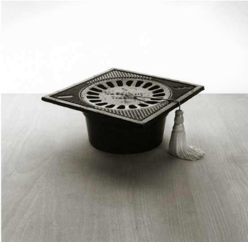
Fotógrafo: Chema Madoz. Sin título. Sin fecha.