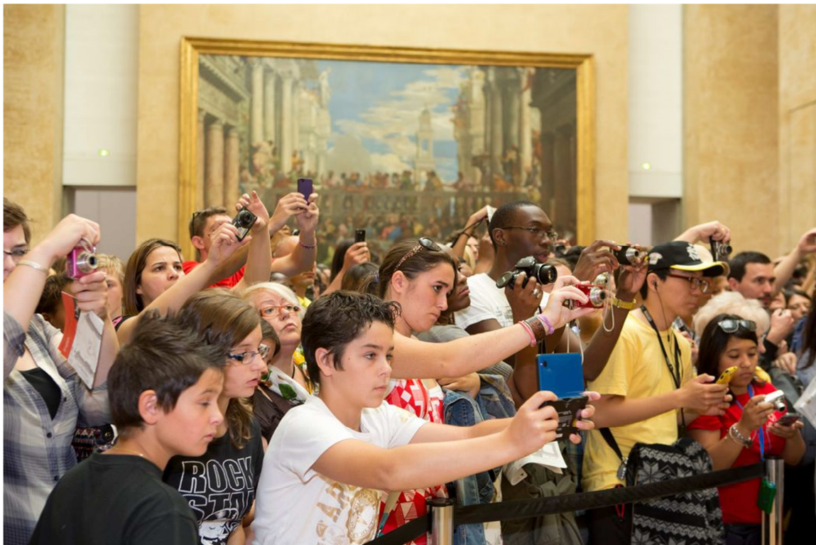
Fotògraf: Martin Parr France. Paris. Louvre. 2012