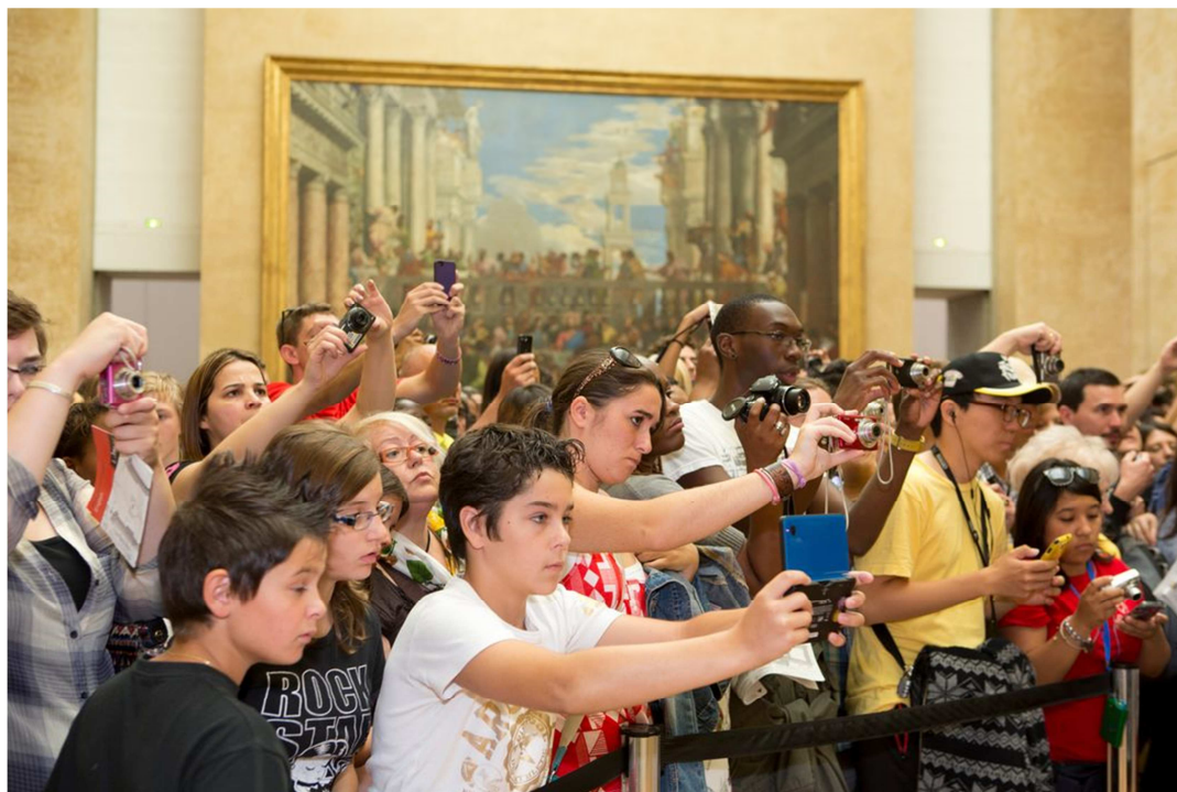
France. Paris. Louvre. 2012.