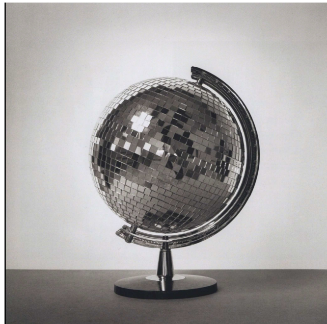
Chema Madoz S-T Robert Klein Gallery