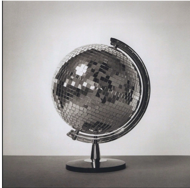
Chema Madoz S-T Robert Clein Gallery