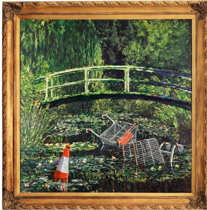
«Show me the Monet» (Banksy, 2005). Reinterpretació del paisatge impressionista de Claude Monet (Pont japonés, 1899). Museu Metropolità d'Art de Nova York.