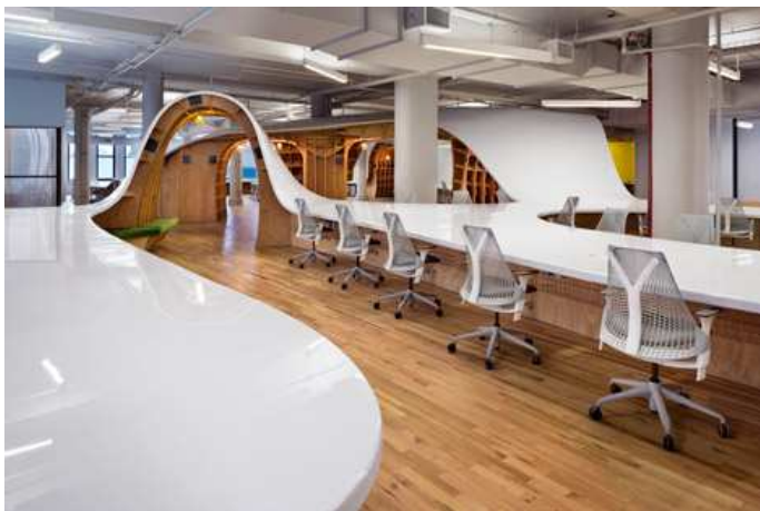
The Barbarian Group, New York, 2014 Categoría: Oficinas