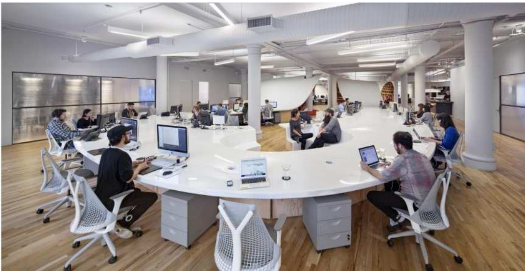
The Barbarian Group, New York, 2014 Categoría: Oficinas

BAREMO DEL EXAMEN: El ejercicio teórico (primera parte) se valorará sobre dos puntos y el ejercicio práctico (segunda parte) se valorará sobre ocho puntos. La suma de ambas partes constituirá la nota global.