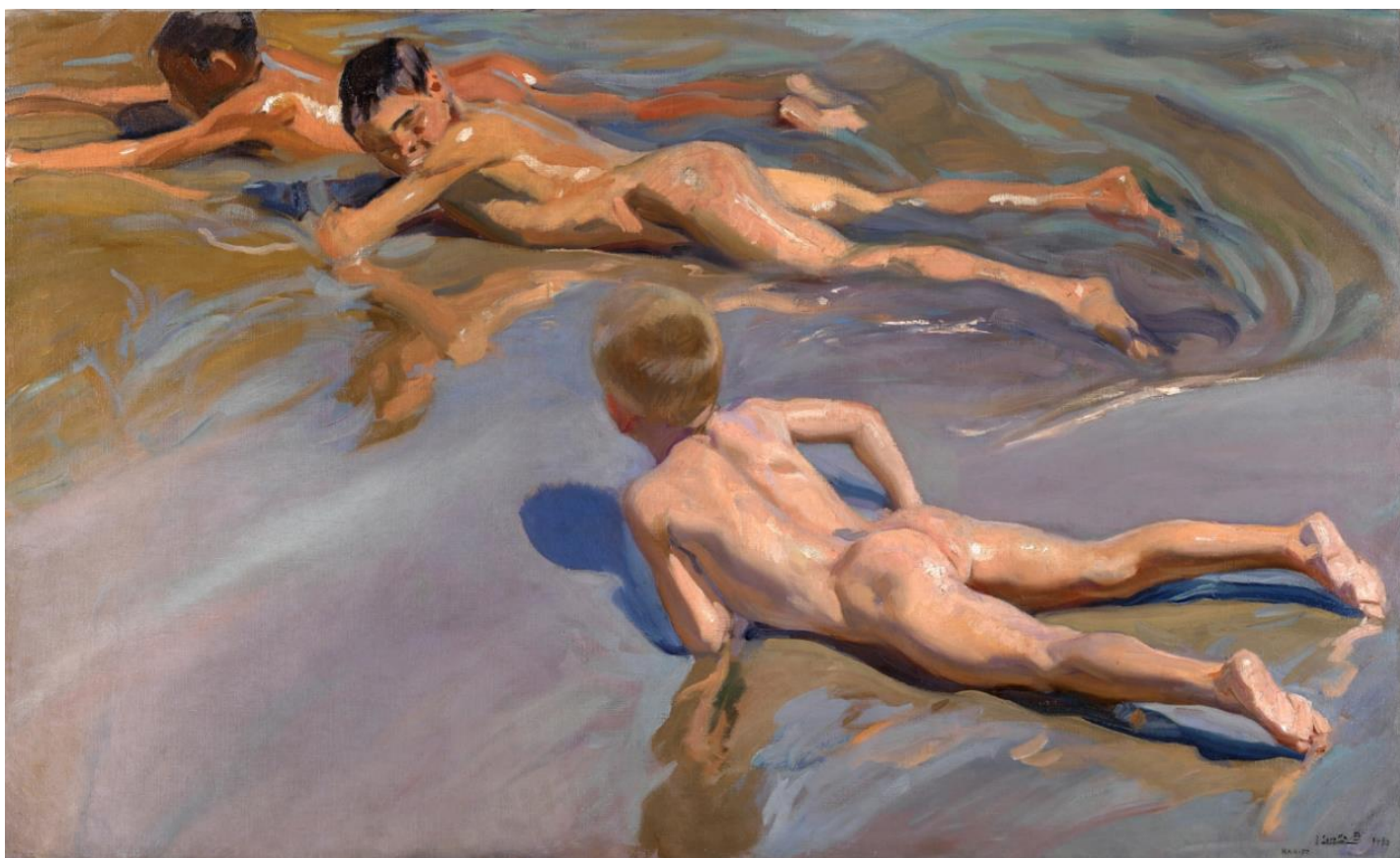
Joaquín Sorolla y Bastida Xiquets a la platja / Niños en la playa , 1910 Oli sobre llenç / óleo sobre lienzo, 118 x 185 cm. Museo del Prado, Madrid (Impresionisme / Impresionismo)

Análisis y comentario de una obra, con los siguientes apartados: contexto y estilo al que pertenece la obra y características de dicha obra en relación a este estilo; autor, obra y estilo personal; análisis descriptivo formal y técnico: composición, color, espacio, luz, texturas, formas, aspectos técnicos, líneas...; análisis iconográfico e iconológico: significado de la obra y repercusión en su momento; y antecedentes e influencias posteriores.