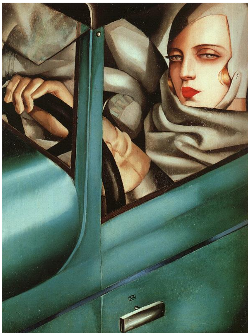
Tamara de Lempicka

Análisis y comentario de una obra, con los siguientes apartados: contexto y estilo al que pertenece la obra y características de dicha obra en relación a este estilo; autor, obra y estilo personal; análisis descriptivo formal y técnica: composición, color, espacio, luz, texturas, formas, aspectos técnicos, líneas...; análisis iconográfico e iconológico: significado de la obra y repercusión en su momento; y antecedentes e influencias posteriores.