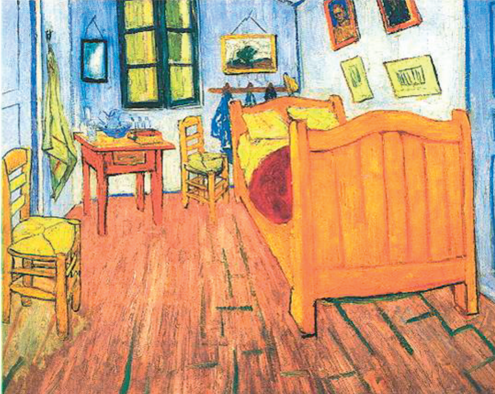
IMATGE 1 / IMAGEN 1 Imatge 1. Van Gogh. L'habitació de Van Gogh a Arles. 1888