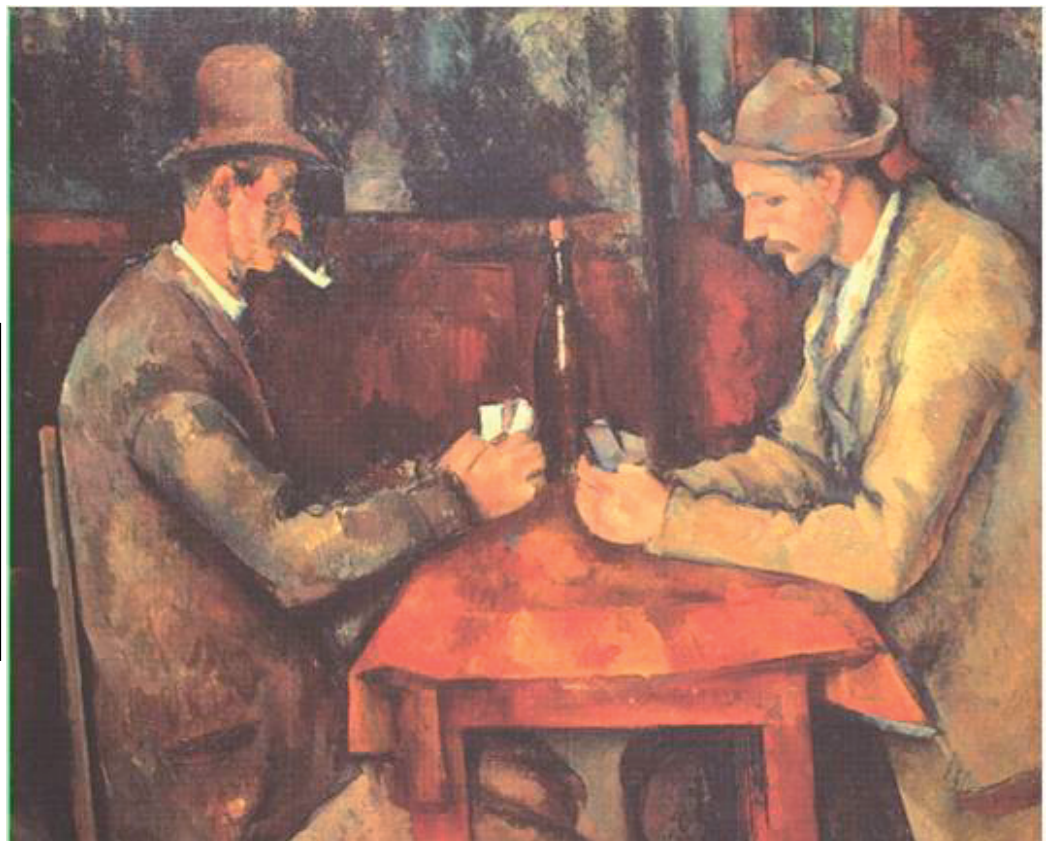
IMATGE 2 / IMAGEN 2 Imatge 2. Paul Cézanne. Els jugadors de cartes. 1893 -1896